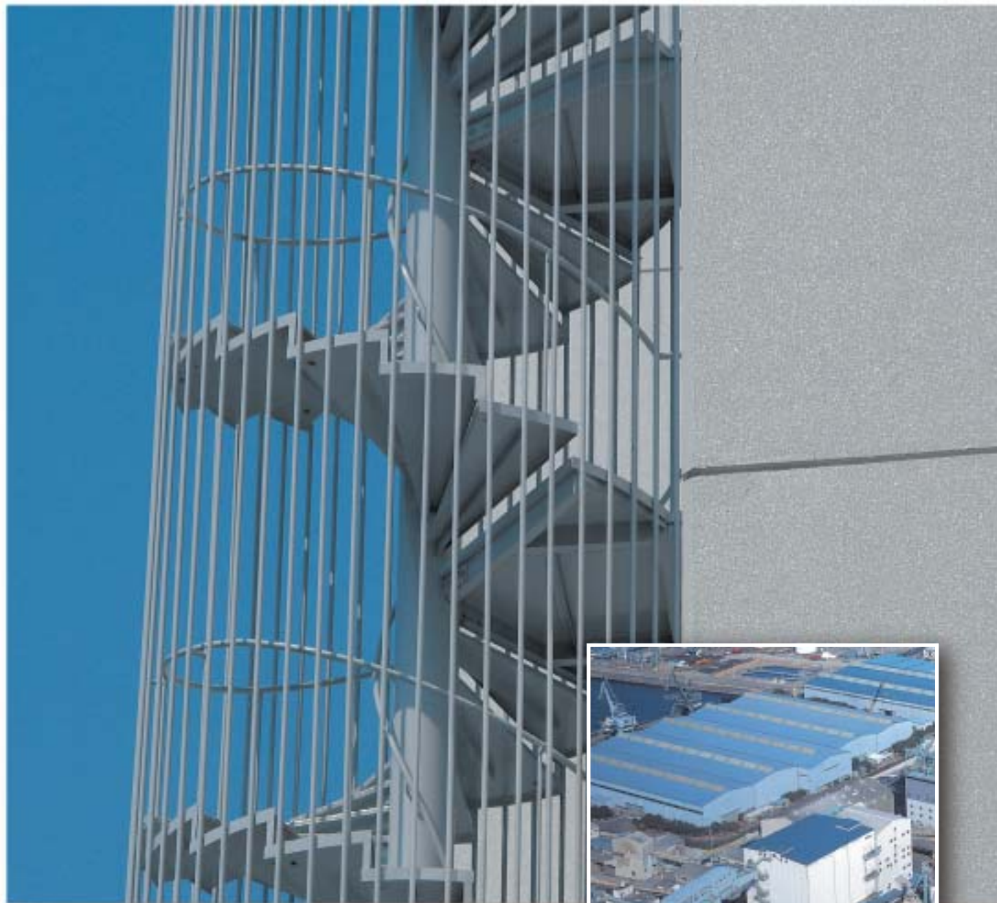
写真はイメージであり、商品とは無関係です。