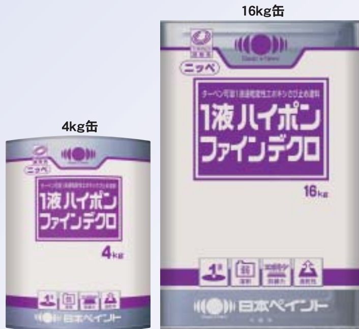
*地域や色相により缶意匠が異なる場合がありますので、あらかじめご了承ください。