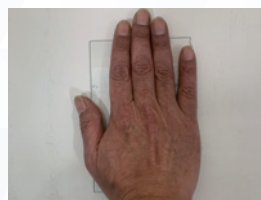
手のひらで規定回数接触