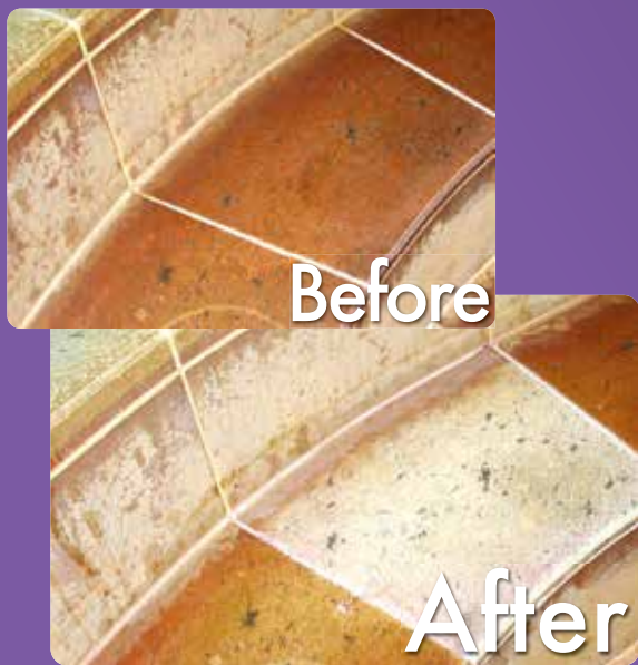
蛇紋石のサビ除去による変色の修復

建築素材に付着・浸透してしまった金属サビや汚れを分解・除去する製品です。中性のため建築素材の劣化や植栽の汚染等を発生させません。従来の酸性薬剤では、トラブルの原因となっていた石材・コンクリート・ステンレス・真鍮等の素材に使用することが出来ます。