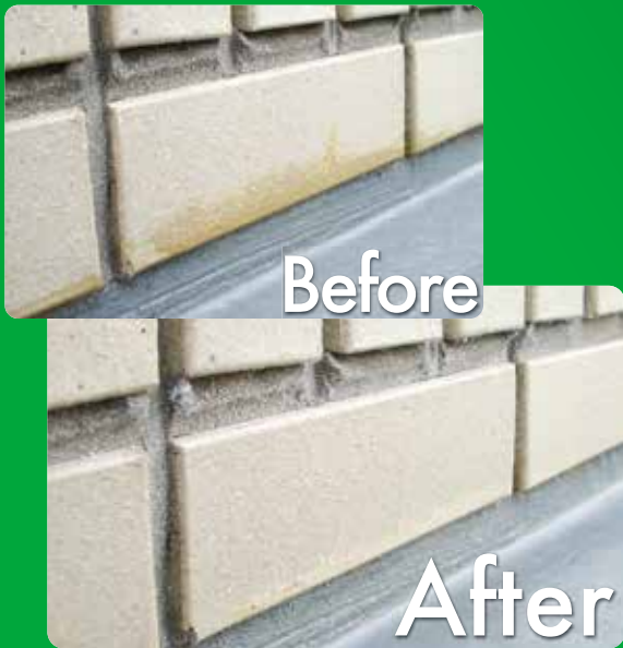
磁器タイル表面のウレタン防水プライマーの除去

一年点検等、施工完了後に変色して問題となる防水剤プライマー・エポキシ樹脂を水性でありながら軟化させ除去することができます。