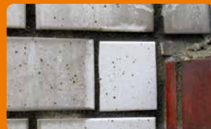
磁器タイル(釉薬付き)