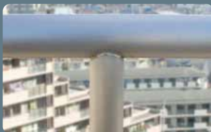
ステンレス手摺り