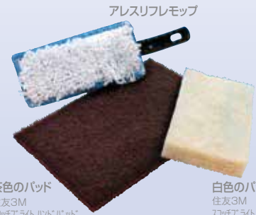
茶色のパッド 住友3M スポンジライト ルドパッド No.7447(茶)業務用