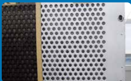
高速道路遮音パネル

※アルミの経年劣化が著しく、表面の保護層が減少している場合、アレスリフレALによりクリアー層がはかれるケースがありますので、必ず試験施工を行ってください。