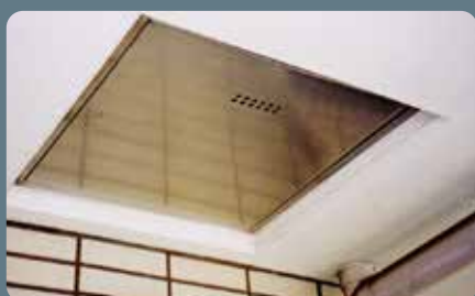
ステンレス製避難ハッチ