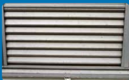
アルミサッシの点サビ