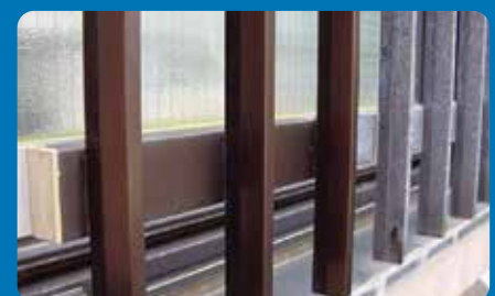
アルミ面格子(ブロンズ)