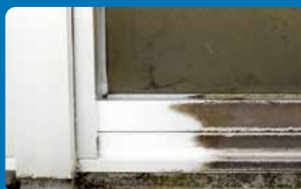
アルミサッシ(シルバー)