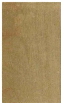
クリスタルガード仕上げ