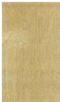
クリスタルガード仕上げ