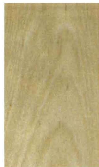
クリスタルガード仕上げ