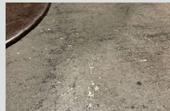
椅子の引きずりによる剥がれ