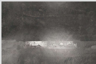
テープによる剥がれ