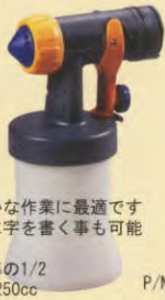
ローボリューム スプレーガン