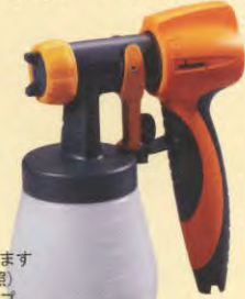
標準ファインコートガン(W660)

※W-640ガンは分割できません 各種(ロー・ハイ・ラジエーター)スプレーガン 使用の場合は、標準ファインコートガン(W660)が ハンドルを別途ご購入下さい P/N 0414201