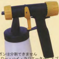
標準ファインコートガン(W640)

※W-640ガンは分割できません 各種(ロー・ハイ・ラジエーター)スプレーガン 使用の場合は、標準ファインコートガン(W660)が ハンドルを別途ご購入下さい P/N 0414201