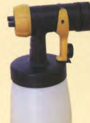
標準スプレーガン(W660)