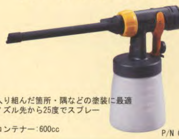
ラジエーターノズル スプレーガン