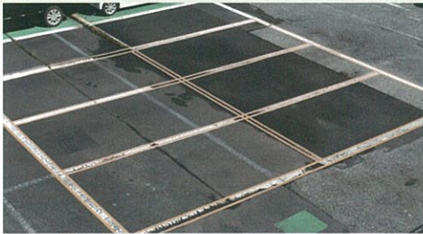
かすれたラインが…